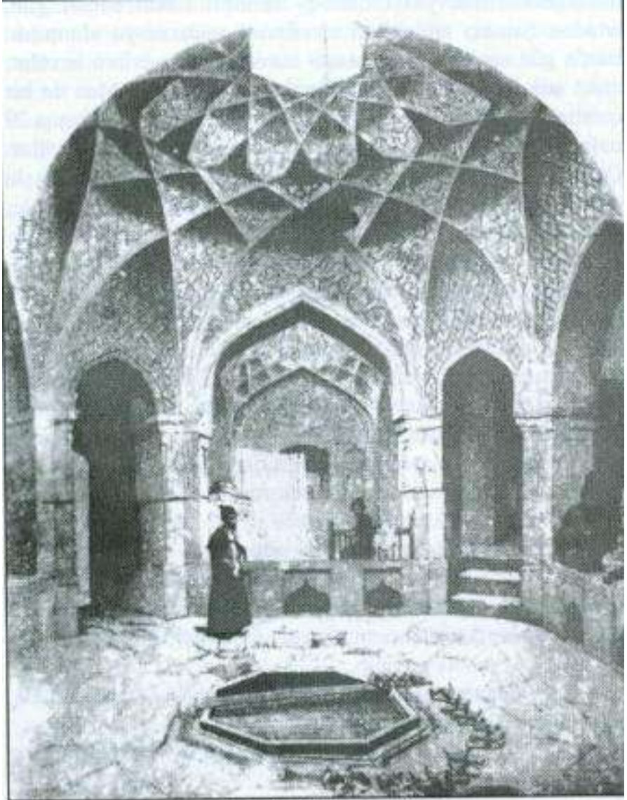
Şamaxıda güzgüli hamam. XVII əsr.