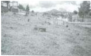
Şamaxıda Səhhət qayıdır.