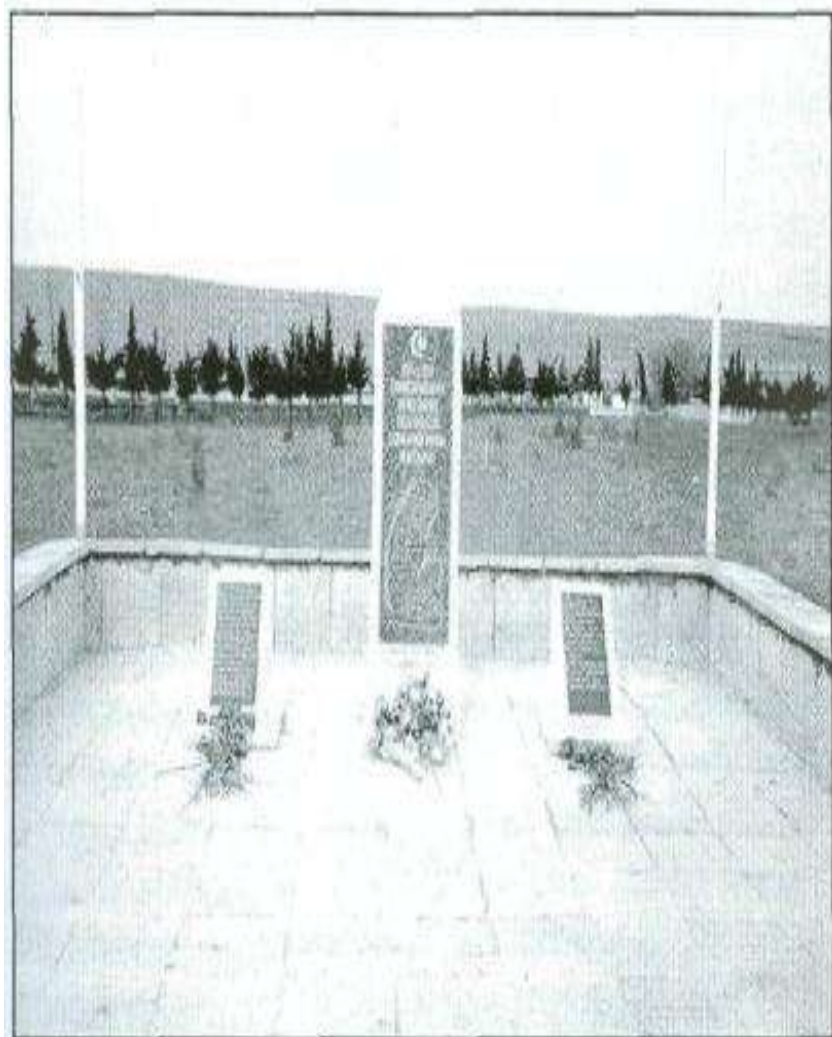
Nərimankənd kəndi, 1918-ci il Şəhidlərinin şərəfinə ucaldılan abidə