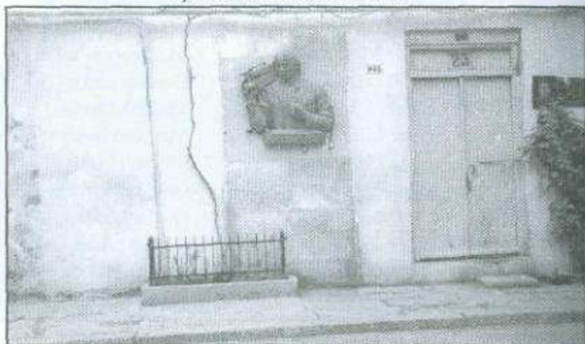
Bakıda Ç.Mustafayevin doğulduğu ev