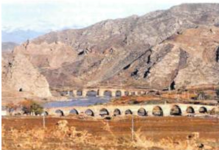
Cobrayil rayonu. On beş aşırımlı Xudafarin körpüsü XI-XII əsr