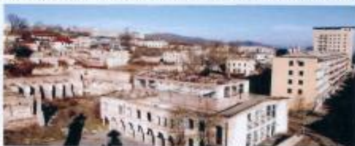
Şuşa şəhəri. İşğaldan sonra.