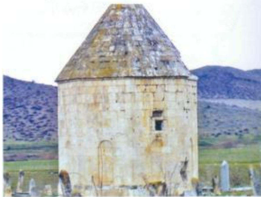
Xocalı rayonu. Qədim məqəbrə