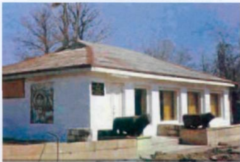
Qubadlı rayonu, Tarix-diyarşünaslıq muzeyi.