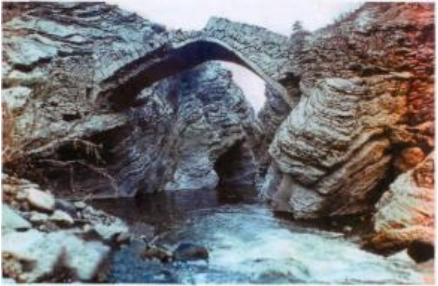
Laçın rayonu, Seyidlar kändi. Birtağlı körpü. XIX asr.