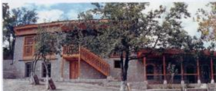
Şuşa şəhəri. Dünya şöhrətli Azərbaycan bəstəkarı, Şorqdo ilk operanın banisi Üzeyir Hacıbəylinin (1885-1948) ev muzeyi. XIX əsr