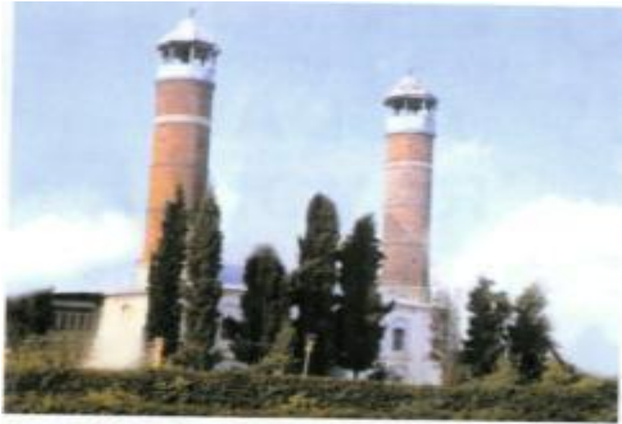
Ağdam şəhəri. Ağdam məscidi. İşğaldan əvvəl