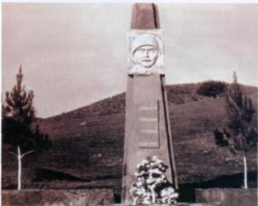
Zəngilan rayonu. Bürünlü kəndi. Böyük Vətən müharibəsində həlak olmuş qəhrəmanların xatirəsinə ucaldılmış abidə.