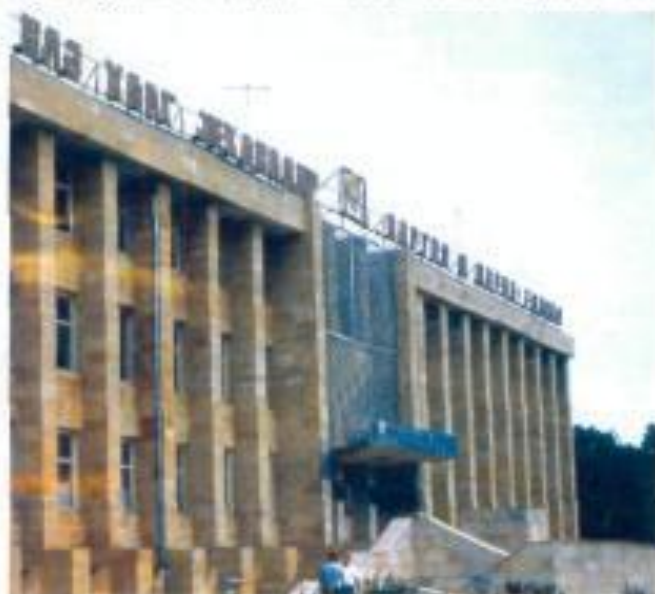
Cobrayil şəhəri. İnzibati bina