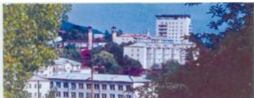
Şuşa şəhərindən görünüş