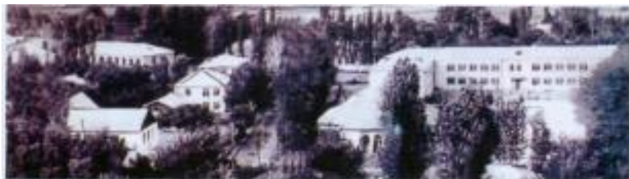
Zəngilan şəhərindən bir görünüş. İşğaldan əvvəl