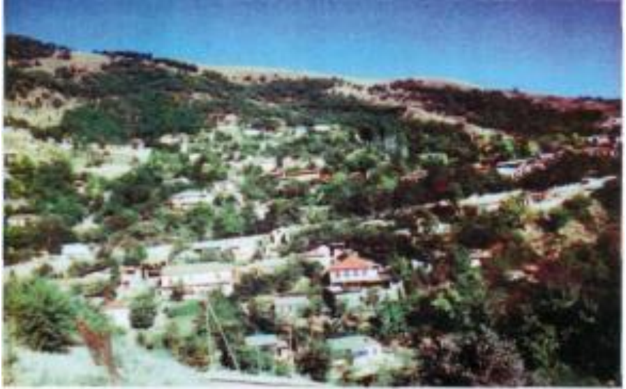
Laçın şaböründen bir görünüş. İşğaldan övval.