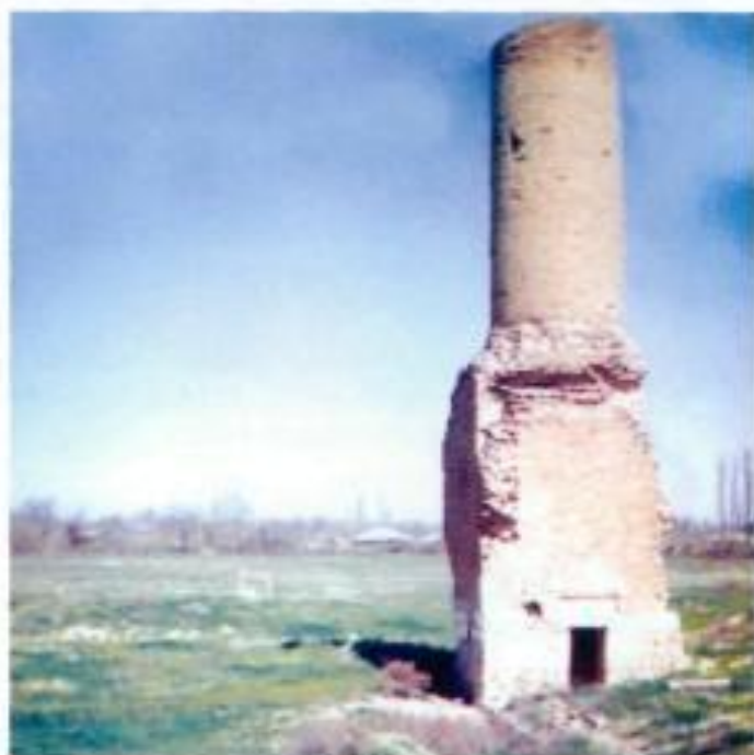
Füzuli rayonu. Babı kəndi. Şeyx Babı türbəsi XIII əsr