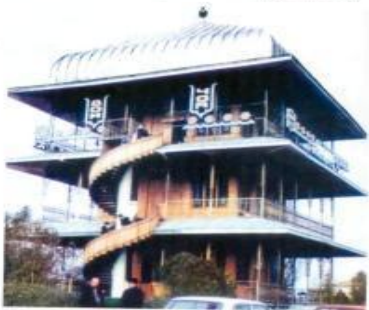
Ağdam şəhəri. Çay evi.