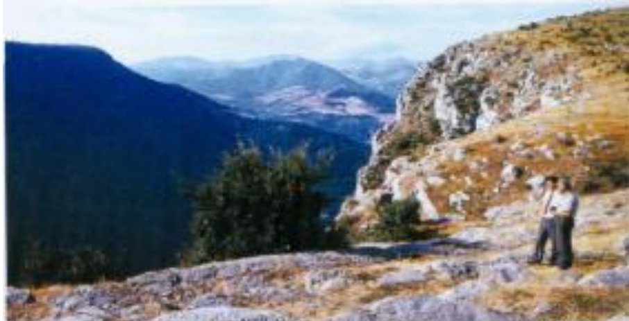
Şuşa şəhərinin erməni işğalından əvvəl məşhur Cadır düzü