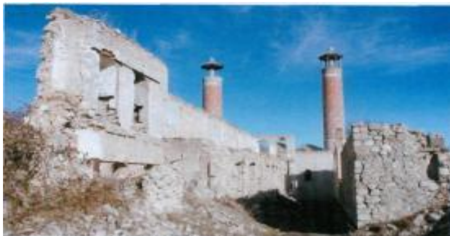
Şuşa şəhəri. İşğaldan sonra. Dağıdılmış Azərbaycan memarlıq inciləri.