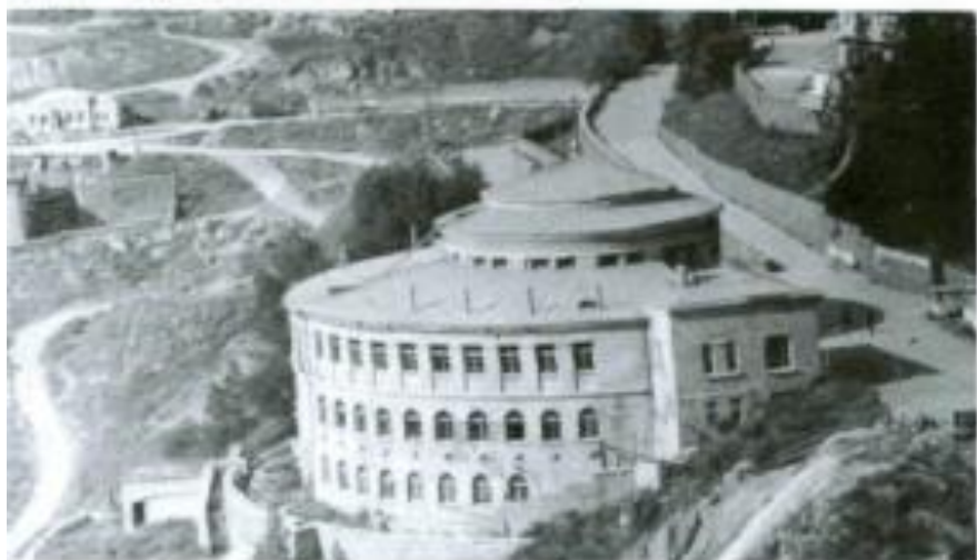
Kalbəcər rayonu. İstisu kurort kompleksi.