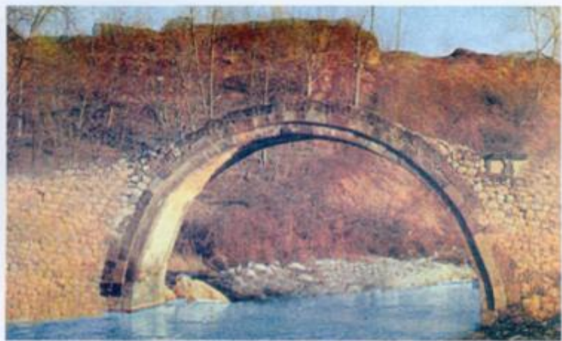
Qubadlı rayonu, Hacıbədəl körpüsü. Ağaçay çayının üzərində XVIII əsr.