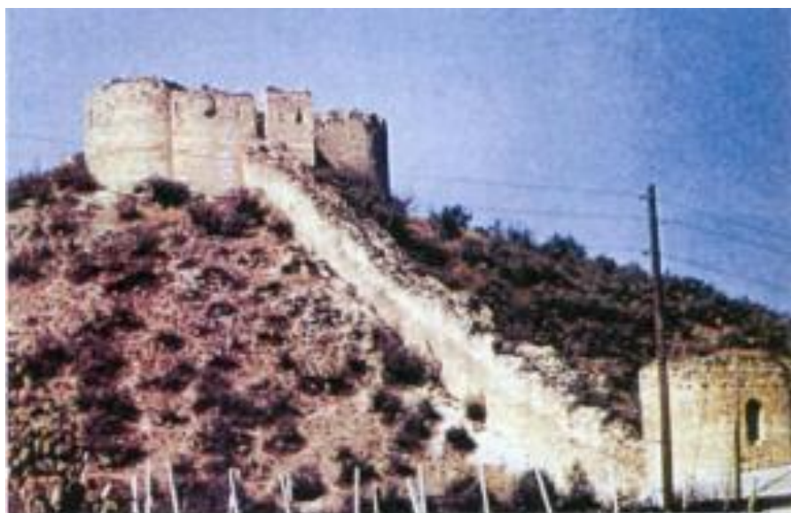
Xocalı rayonu. Əsgoran qalasının aşağıdan görünüşü. XVIII əsr.