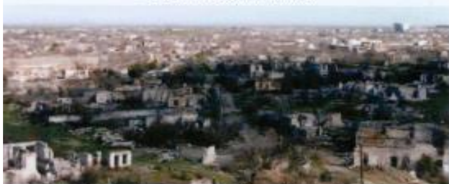
Ermeni işğalından sonra xarabəliyə çevrilmiş Ağdam şəhəri.