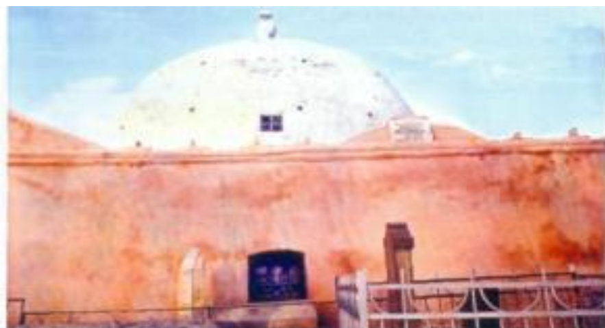
Füzuli rayonu Əhmədahlılar kəndi. Hazratı Cərciz türbəsi