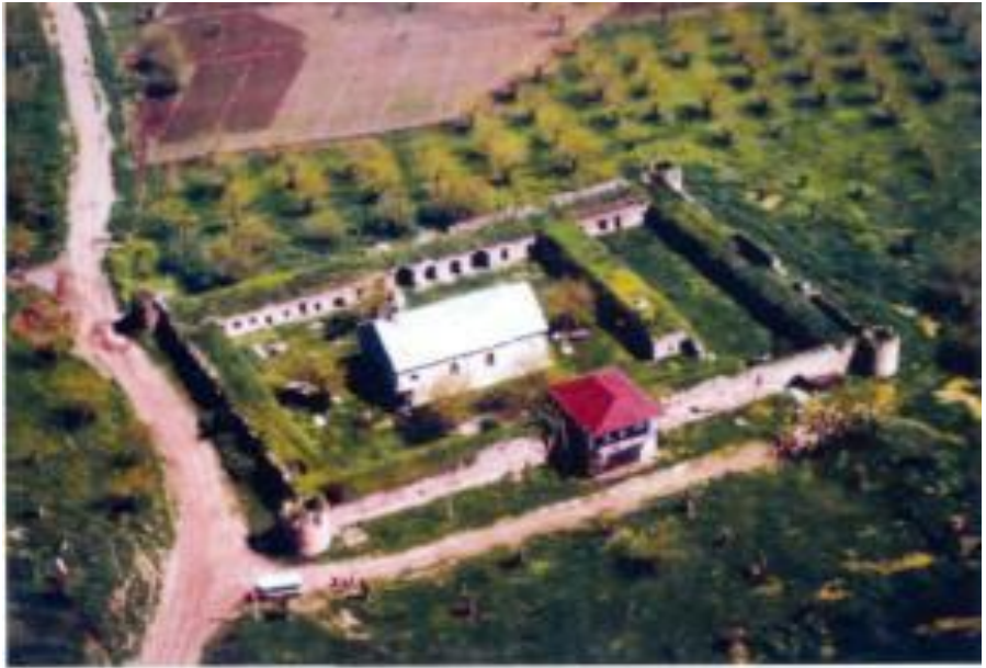
Xocavand rayonu. Sos kəndi. Alban Amarass məbədi IV əsr Alban məbədi