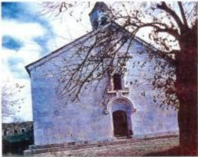
Xocavand rayonu. Alban Amarass məbədi. IV əsr.