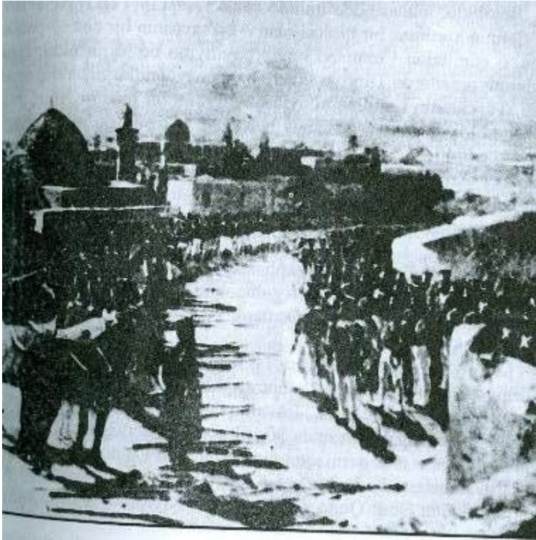
Rus ordusunun İrəvanı işğal etməsi (1827). Rəssam Rubo.